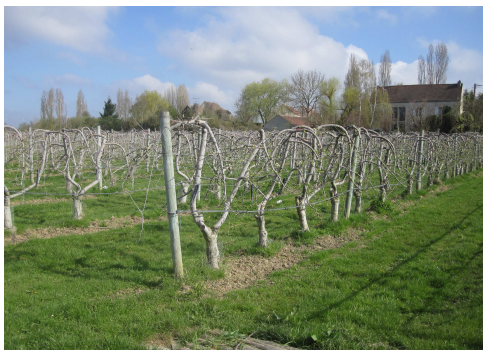
Exploitation, Maison Gaillard, Les Alluets le roi (78) www.maisongaillard.fr